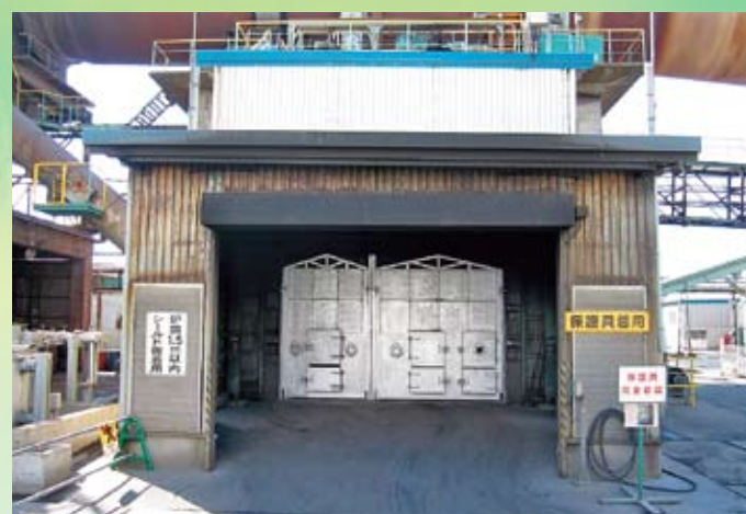
トランス類本体加熱分離処理施設