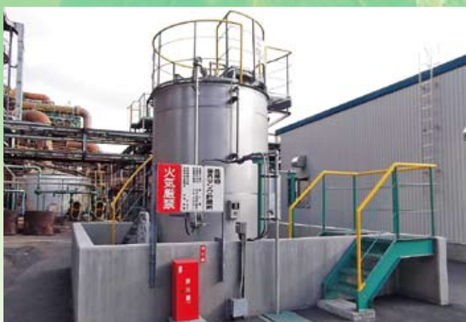
15kℓ低濃度PCB廃油タンク