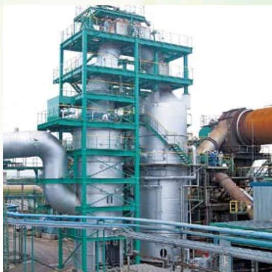
廃油焼却処理施設