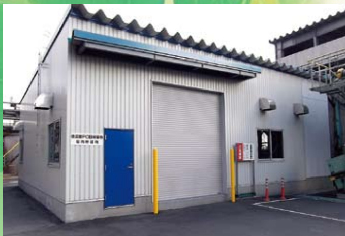
低濃度PCB廃棄物室内貯蔵所