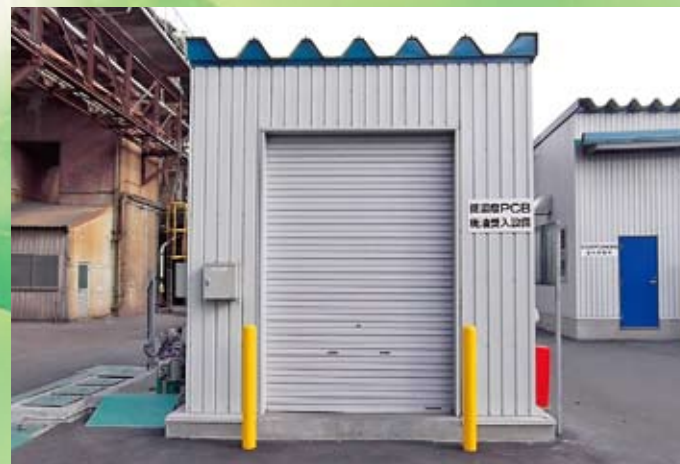
低濃度PCB廃油受入設備